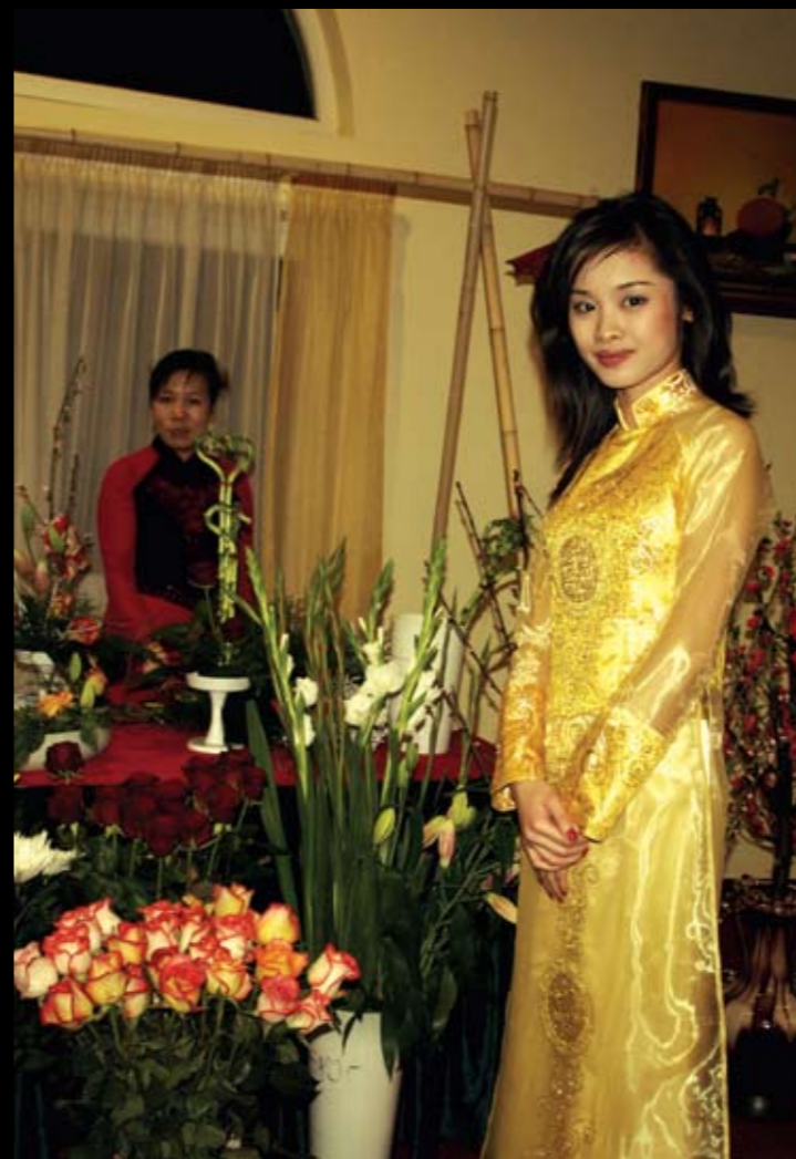
Vietnamský lunární Nový rok Tet Nguyen Dan

Nejčastějším příjmením v okrese Teplice je Nguyen. Lidí s takovým jménem tu žije 490. Dosud platilo, že nejvíce lidí nosí příjmení Novák, těch je nyní 438 a stejný počet žen nosí příjmení Nováková. Tím Nguyen přichází o pomyslné absolutní prvenství, protože pod tímto jménem se skrývají jak muži, tak ženy. Nejpočetnější skupinou z 5 926 cizinců žijících na Teplicku jsou právě Vietnamci. Žije jich tu z 146.