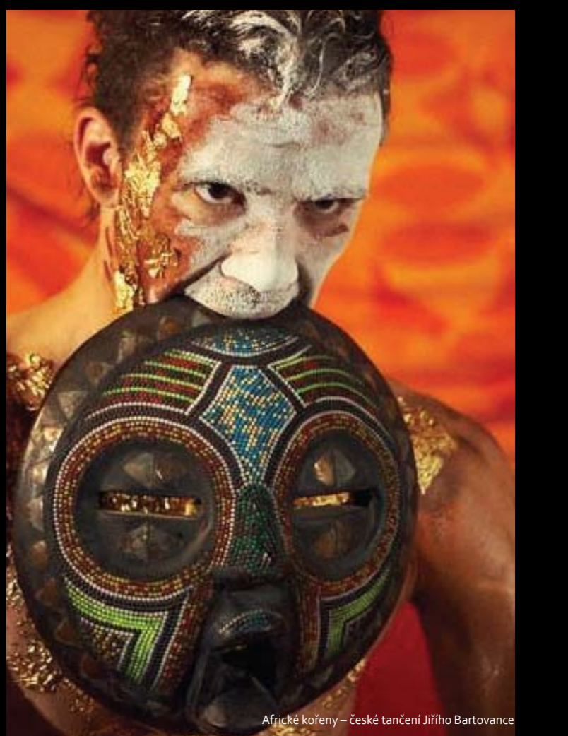
Všichni jsme Afričani po deváté