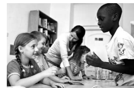
Letní kurz

Kromě těchto hlavních vzdělávacích aktivit otevřela META minulý rok i další kurzy jakými byly například přípravné