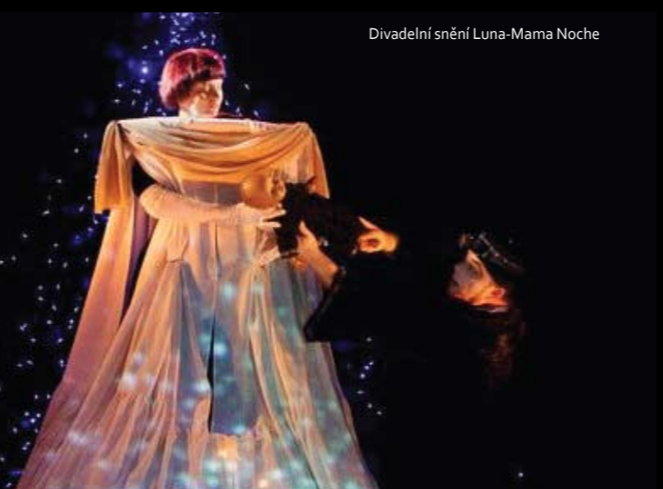
Divadelní snění Luna-Mama Noche