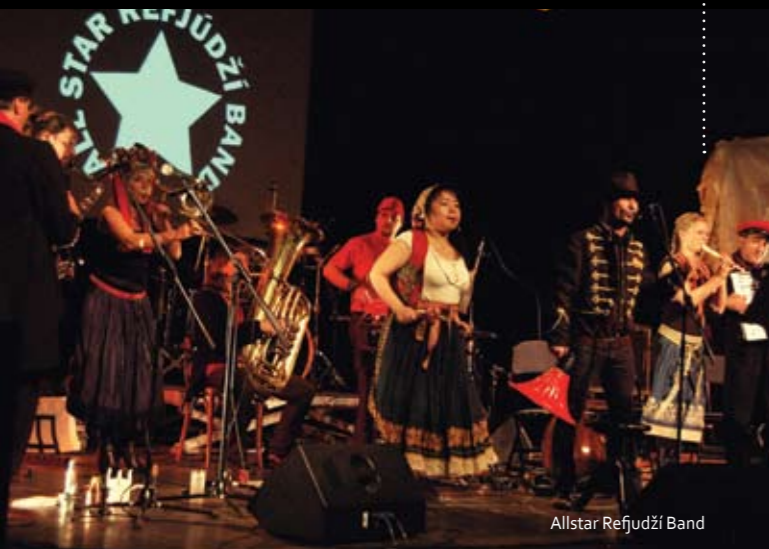
Allstar Refjudží Band